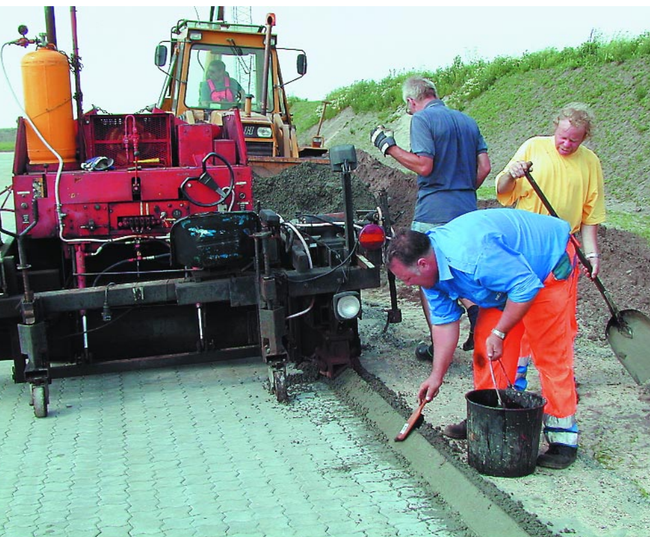
Betontant under udførelse