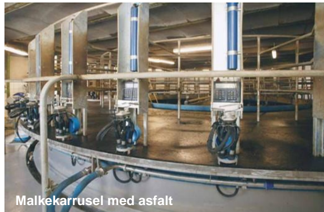
Malkekarrusel med asfalt