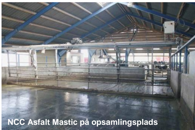
NCC Asfalt Mastic på opsamlingsplads

Som bindemiddel anvendes en hård specialbitumen (eller modificeret bitumen), der sikrer god modstand mod indtryksmærker samt god fleksibilitet. Bitumen er et olieprodukt, der anvendes som bindemiddel i asfalt. Det nedbrydes ikke af syrer.